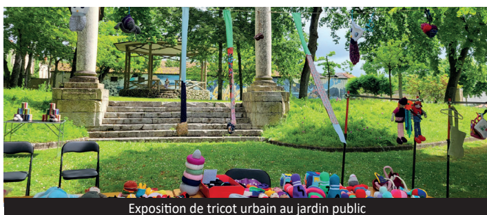
Exposition de tricot urbain au jardin public