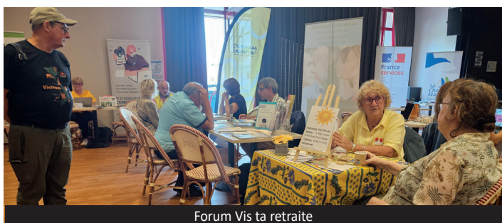
Forum Vis ta retraite