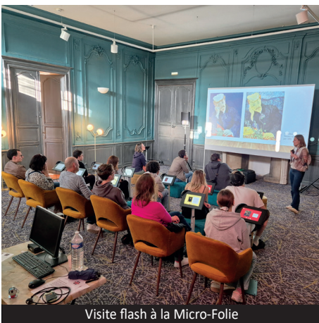
Visite flash à la Micro-Folie