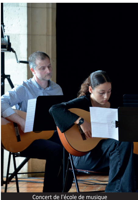
Concert de l'école de musique