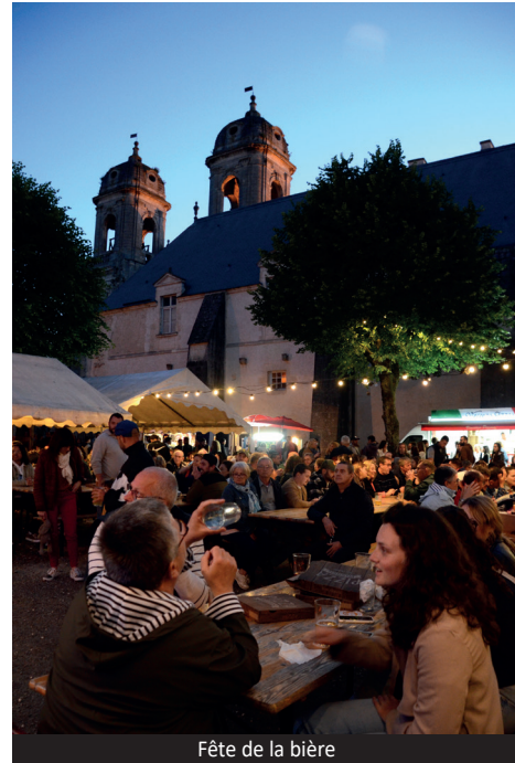
Fête de la bière