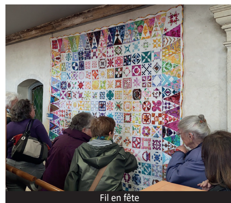
Fil en fête