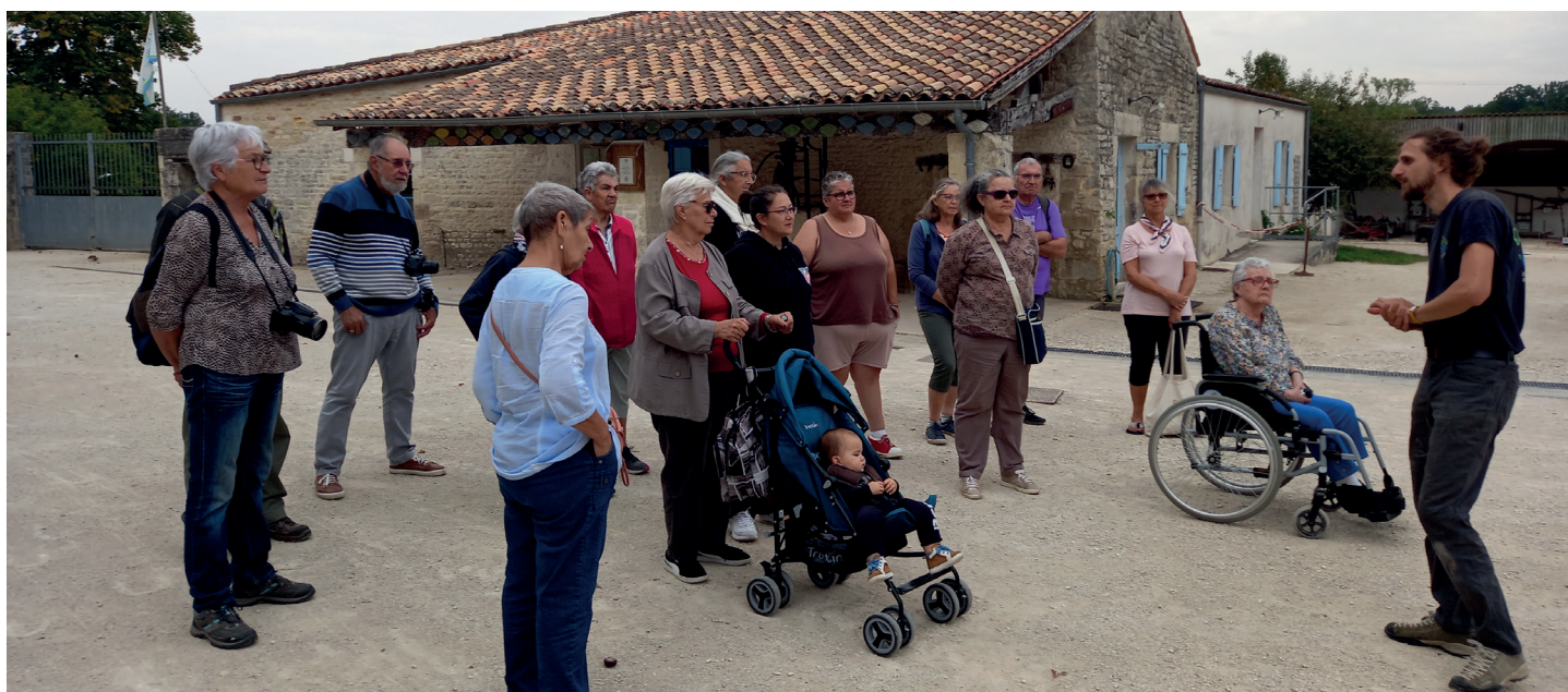
Sortie à l'asinerie du Baudet du Poitou en 2023

2024 est une année importante pour le service Cap séniors et solidarité qui fête déjà ses 10 ans. D'année en année, le service n'a cessé de multiplier ses propositions de services et de fédérer bénévoles et acteurs associatifs pour vous accueillir au mieux au sein de la Maison du Vivre Ensemble et répondre à vos attentes. Dix ans est donc un bon moment pour faire le bilan de la décennie.