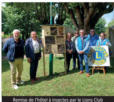
Remise de l'hôtel à insectes par le Lions Club