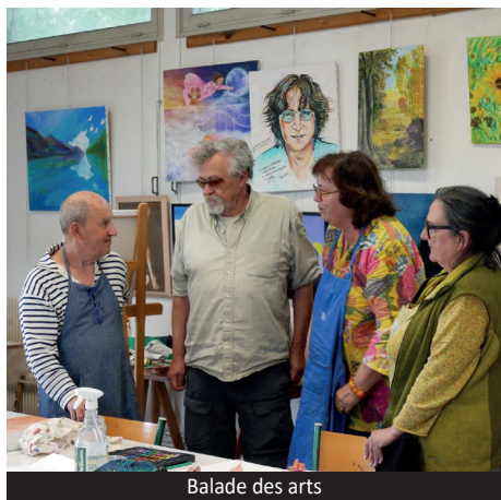
Balade des arts