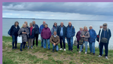
Sortie du 17 mai à l'île d'Aix

Vendredi 17 mai, le service Cap Séniors a organisé une sortie à l'Île d'Aix pour les Angériens de plus de 60 ans. 20 personnes ont profité, malgré un temps plutôt maussade, d'un moment de détente avec au programme : repas au restaurant "les Paillotes", visite panoramique sur le fort Boyard et visite du fort de la Rade et temps libre l'après-midi. Plaisir partagé par tous qui ont profité au maximum de l'air pur marin et du calme qui règne sur cette île sauvage sans voiture.