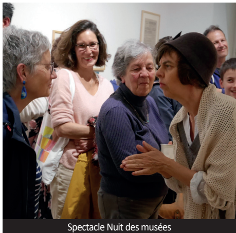
Spectacle Nuit des musées