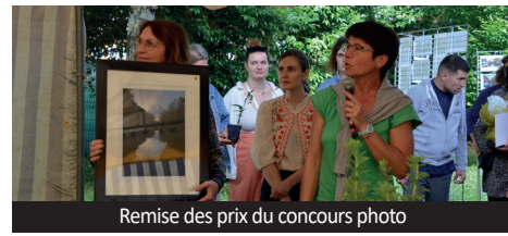
Remise des prix du concours photo