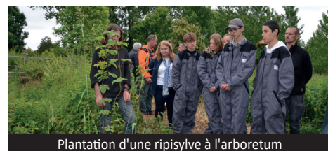
Plantation d'une ripisylve à l'arboretum