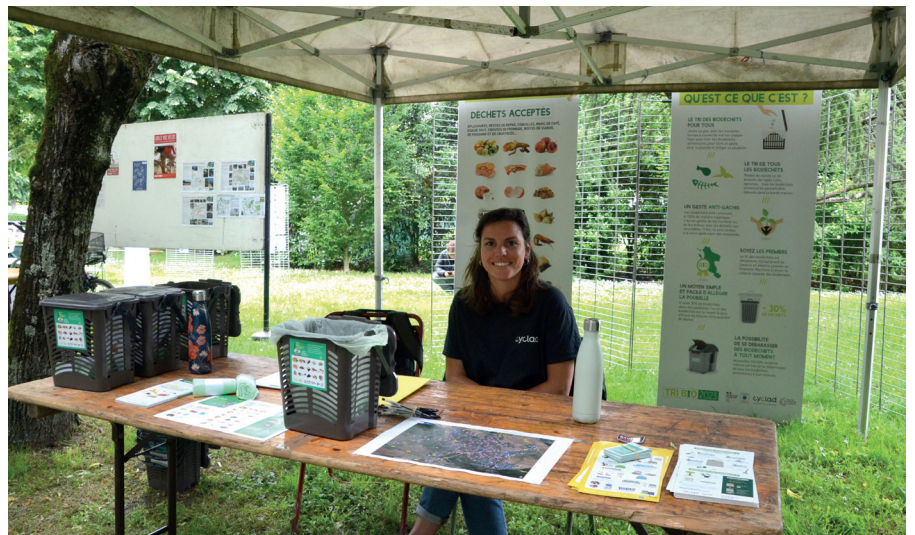
Distribution de kits biodéchets lors de la fête de la nature par Cyclad

Évitons le gaspillage alimentaire, et sinon "biodéchétisons".