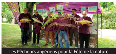
Les Pêcheurs angériens pour la Fête de la nature