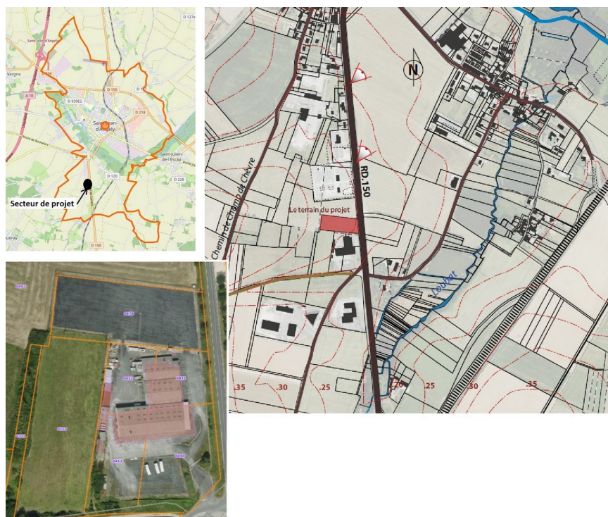
Localisation du secteur de projet