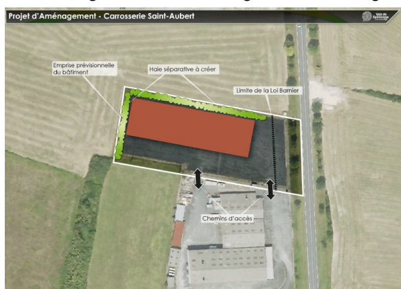
Orientation d'aménagement et de programmation projetée (OAP)

La zone AUx existante n'est pas couverte par une OAP dans le PLU en vigueur. La révision allégée n°3 prévoit une OAP uniquement pour la parcelle en extension de la zone AUx. La MRAe rappelle que l'OAP doit être établie sur l'ensemble de la zone AUx et son extension conformément à l'article R 151-20 du Code de l'urbanisme. L'orientation d'aménagement et de programmation, attendue sur la totalité de la nouvelle zone AUx permettrait d'assurer la cohérence globale des aménagements envisagés.