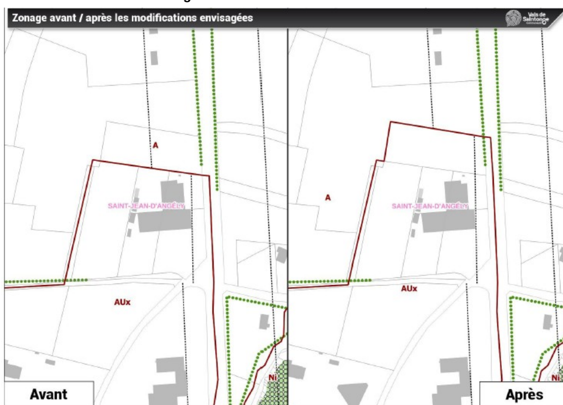
Extraits du plan de zonage avant et après la révision allégée n°3

Elle recommande également de fournir des indicateurs permettant, à partir d'un état initial, d'assurer un suivi des effets de la révision allégée n°3 sur l'environnement.