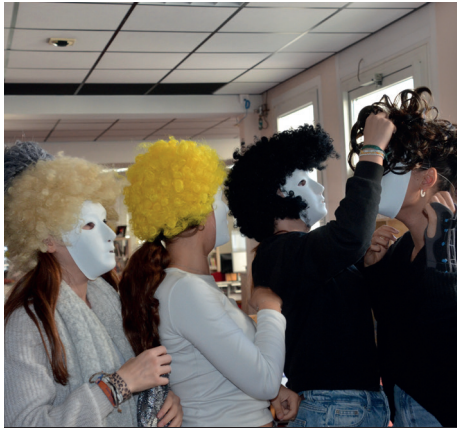
Graines d'artistes au lycée Louis-Audouin-Dubreuil