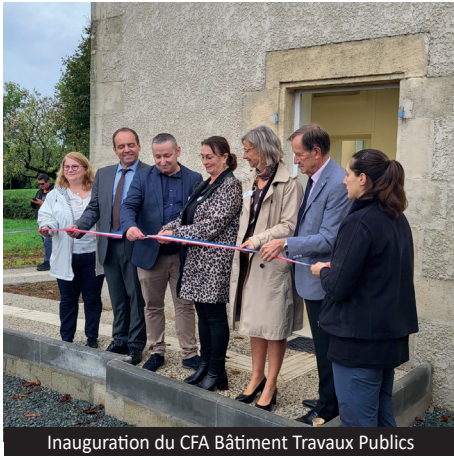
Inauguration du CFA Bâtiment Travaux Publics