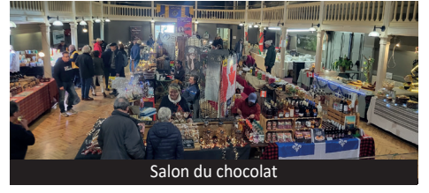
Salon du chocolat