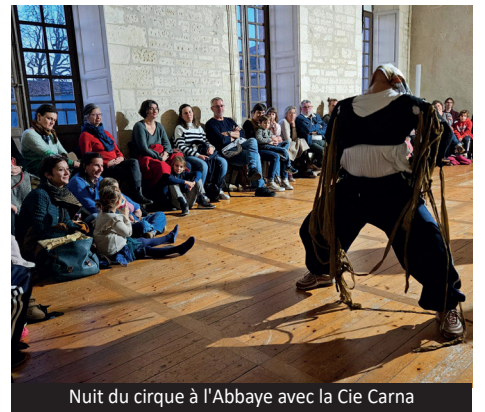
Nuit du cirque à l'Abbaye avec la Cie Carna