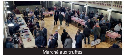
Marché aux truffes