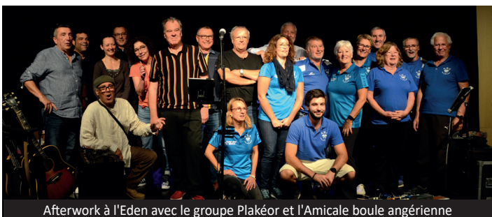
Afterwork à l'Eden avec le groupe Plakéor et l'Amicale boule angérienne