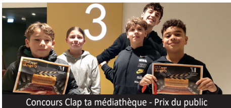
Concours Clap ta médiathèque - Prix du public