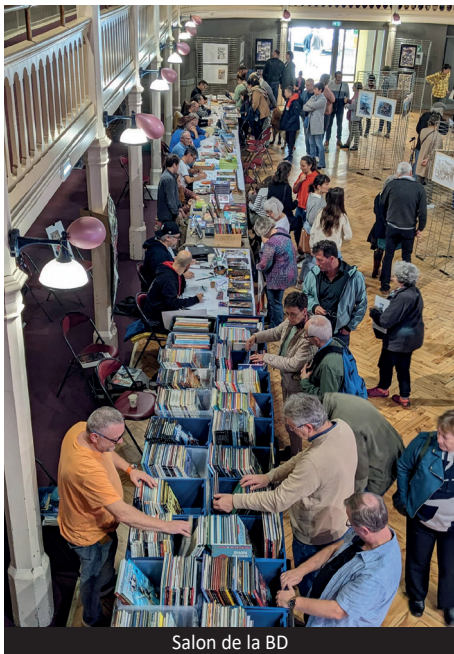
Salon de la BD